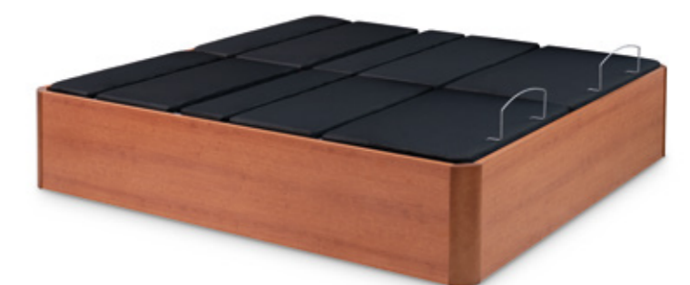
CANAPÉ TOTALMENTE APOYADO AL SUELO